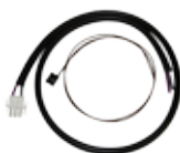
Art-Nr. 2007 Kabelsatz für Anschluss Solar-Regler an EBL mit Solarstromanzeige